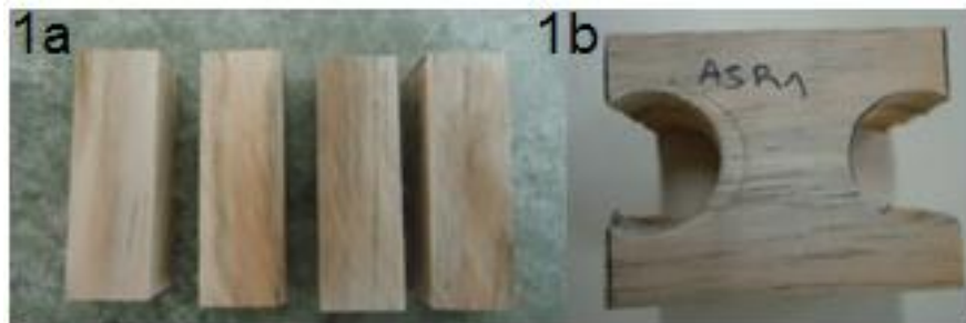
Figura 1. Probetas para determinación de módulos de rotura y elasticidad. a) Probetas para ensayo de compresión paralela a las fibras. b) Probeta para ensayo de tracción perpendicular a las fibras

Nota: dap: diámetro a la altura de pecho, h: altura total, hbcv: altura hasta la base de la copa verde, dbcv: diámetro en la base de la copa verde.